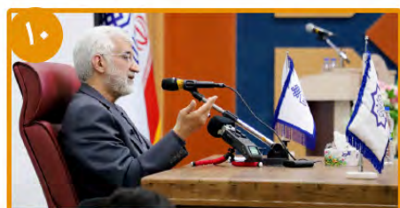
برگزاری جلسه پرسش و پاسخ دانشجویی با حضور نماینده مقام معظم رهبری در شورای عالی امنیت ملی