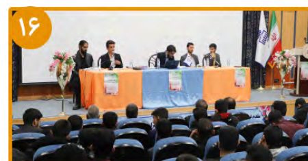
کرسی آزاداندیشی «صدایی که فریاد شد» در دانشگاه بیرجند برگزار شد