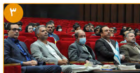
آیین افتتاحیه نوزدهمین همایش بین المللی تلسی برگزار شد