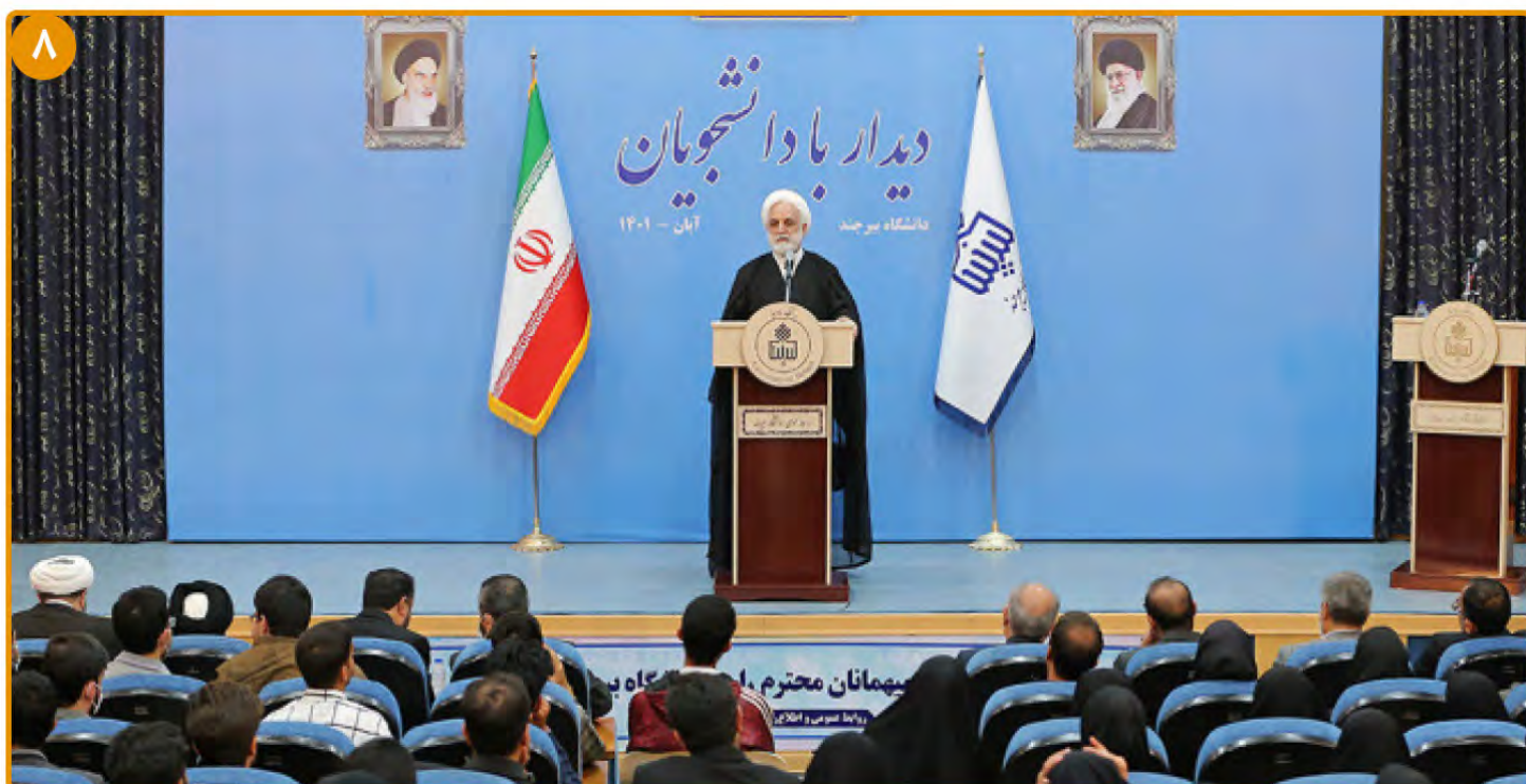
رئیس قوه قضائیه در دانشگاه بیرجند با دانشجویان دیدار کرد