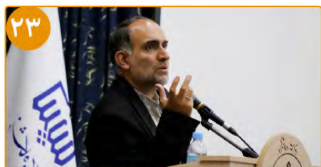
بررسی و تحلیل اولویتهای فرهنگی در استان خراسان جنوبی