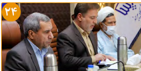
جلسه بررسی وضعیت آموزش عالی استان با تکیه بر دانشگاه بیرجند